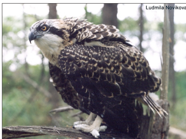
Слеток скопы ( Pandion haliaetus ), выросший в гнезде на платформе.

Нижегородское отделение Союза охраны птиц России ежегодно проводит проверки состояния и использования птица-