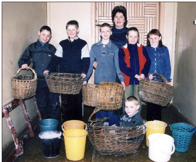
Школьники с корзинами для сов.

School children with owl baskets.