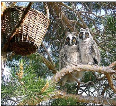
Птенцы ушастой совы ( Asio otus ) около гнезда.

Н.Ю. Киселёва, Л.М. Новикова (Нижегородское отделение Союза охраны птиц России, Н.Новгород, Россия)