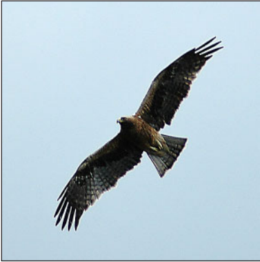
Орёл-карлик ( Hieraetus pennatus ).

Распределён на изучаемой территории неравномерно. Так, в долине р. Кинель – нередок и встречался как небольшими группами по 2–3 пары, так и одиночными парами: 21 июля 2003 г. мы наблюдали самца тювика около гнезда и неоднократно отмечали слётков на гнездовых участ-