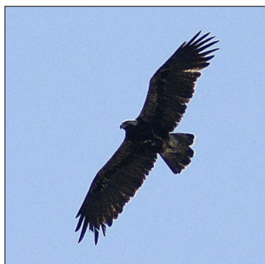
Могильник ( Aquila heliaca ).

Анализируя особенности распределения и численности хищных птиц долин рек Кинель и Сок, следует отметить ряд существенных различий. Это, во-первых, замет-