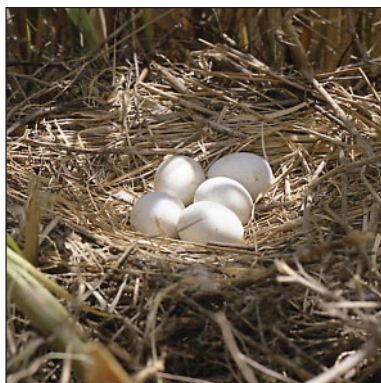
Гнездо болотного луня ( Circus aeruginosus ) с кладкой.

Типичный хищник тростниковых и рогозовых зарослей. В долине р. Кинель было встречено 6 территориальных пар, из них 4 – в пойме и 2 – на стационарах. Плот-