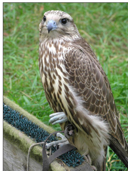
Балобан – любимая охотничья птица арабских сокольников.

The main regions of saker catching are 1. foothills of Altai, south-eastern Altai and western Tuva; 2. Tuva depression (Republic of Tuva), north-west of the Minusinsk depression, steppe depressions of the Baikal region (fig. 1).