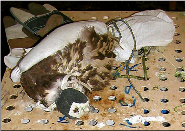
Балобан, погибший во время перевозки контрабандистами.

A Saker died during transportation by smugglers.