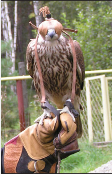
Ловчий балобан ( Falco cherrug ).

1970-х гг. в связи с устойчивым экономическим ростом. Тогда фактически заново сформировался рынок соколов, правила которого диктовались желаниями шейхов. Особенность данного рынка в том, что основной интерес проявляется к крупным соколам – сапсану ( Falco peregrinus ), балобану ( Falco cherrug ) и кречету ( Falco rusticolus ), т.е. к видам, гнездовой ареал которых находится за пределами арабских стран. Самой предпочитаемой птицей является балобан. Кречет плохо переносит условия жизни в пустыне, а сапсан не может брать объекты традиционной добычи арабских охотников (дрофа-красотка Chlamydotis undulata и заяц-толай Lepus tolai ) из-за иной стратегии охотничьего поведения. Поэтому именно балобан пользуется наибольшим спросом.