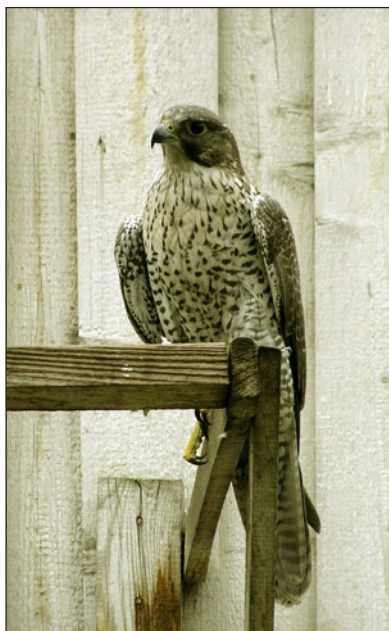
Кречет ( Falco rusticolus ), выращенный в питомнике.

В 80-х гг. основной упор делался на отлов балобана, причём ловились как взрослые птицы, так выбирались и птенцы из гнёзд (Левин, 2001).