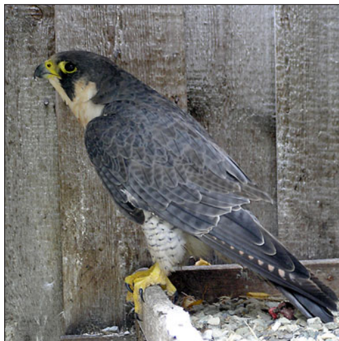
A Peregrine Falcon ( Falco peregrinus ) bred in the «Altai Falcon Center».