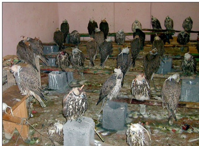
Партия соколов, задержанная при попытке незаконного вывоза.

However the development of Russian falconry is on the embryonic stage, and the essential progress of it is doubtful next 10–15 years.