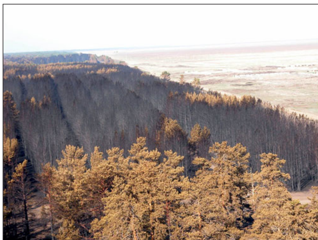
Участки бора, сгоревшие в 2006 г. The areas of a pine-forest burned in 2006.

Несмотря на то, что леса Павлодарской и Семипалатинской областей объявлены национальным достоянием и выделены в категорию особо охраняемых территорий,