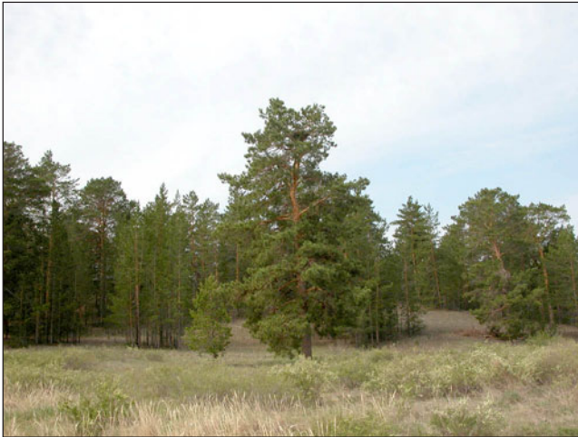
Типичное гнездо балобана ( Falco cherrug ) в постройке могильника ( Aquila heliaca ).

The typical nest of the Saker Falcon ( Falco cherrug ) placed in an old nest of the Imperial Eagle ( Aquila heliaca ).