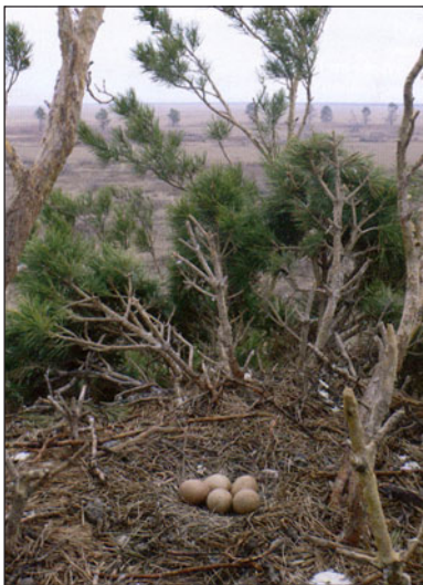
Кладка балобана в старом гнезде могильника.

Затем были осмотрены кромки лесных массивов в районе пос. Шалдай, Есильбай, Корт, Майкапчагай и Казантай. Перспек-