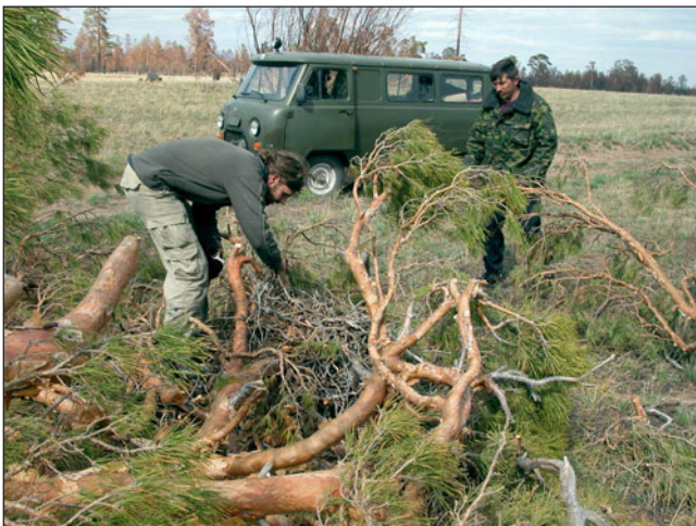
A pine tree with the saker's nest felled by woodcutters.