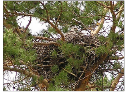
Самка балобана в гнезде.

Длина маршрута по лесам Павлодарской и Восточно-Казахстанской областей составила 1485 км. В 2006 г. на знакомство с лесными массивами было затрачено 4 недели по сравнению с одной неделей в предыдущий сезон. Наибольшее внимание было уделено сохранившимся от пожаров