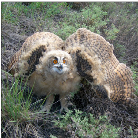
Слёток филина ( Bubo bubo ).

крупного останца (высота около 40 м) на гребне. Гнездо, расположенное в достаточно глубокой и слегка наклоненной нише в скале, находится примерно в 10–15 м от