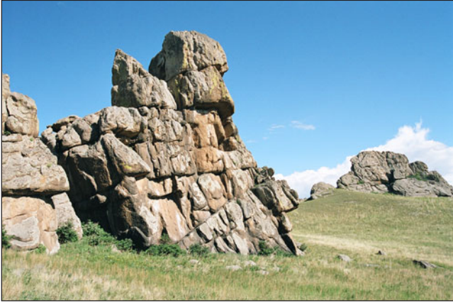
Скала-останец с гнездом мохноногого курганника ( Buteo hemilasius ).

A single rock with a nest of the Upland Buzzard ( Buteo hemilasius ).