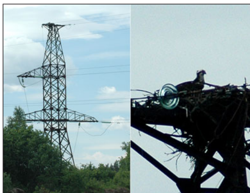
Гнездо скопы ( Pandion haliaetus) на опоре ЛЭП. 04.06.2007.