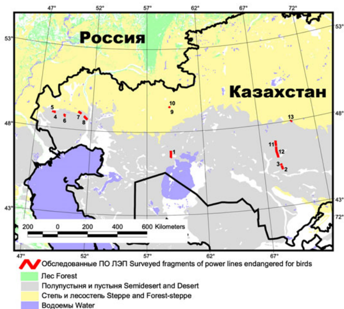
Рис. 1. Обследованные участки птицеподобных ЛЭП в Казахстане в 2003–2007 гг. Нумерация участков на рисунке соответствует нумерации в таблицах 1–3

В условиях интенсификации в Казахстане нефте- и газодобычи и развития инфраструктуры нефте- и газопроводов, а также сопутствующей им инфраструктуры антикоррозионных ЛЭП, была предпринята попытка оценить ущерб, нанесённый как местным, так и мигрирующим хищным птицам птицеподобными ЛЭП (ПО ЛЭП) в нескольких модельных природных районах Западного и Центрального Ка-