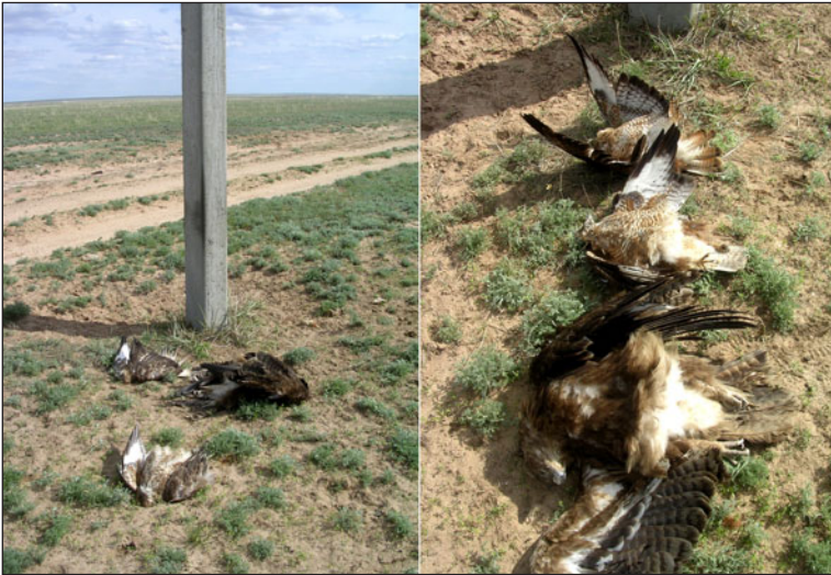
Степной орёл и два ка- нюка, погибшие от пора- жения электротоком в течение дня на одной опоре ПО ЛЭП.

Steppe Eagle and two buzzards, electrocuted on an electric pole during a day.