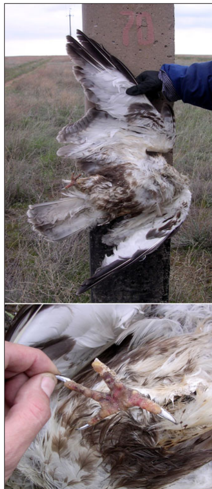
Зимняк ( Buteo lagopus ), погибший от поражения электротоком на ПО ЛЭП (верхнее фото) с характерными следами ожогов на лапах (нижнее фото).

10 km) about 58000 birds of prey are projected to be killed by electrocution every year only during spring migration (8 weeks). And the Steppe Eagles dominate absolutely – about 29000 individuals. 355500 individuals of electrocuted birds of prey are the species listed in the Red Data Book of Kazakhstan for murdering of which are punished by the legislation. However the state nature protection bodies do not undertake any efforts on punishment of owners of “power lines-killers”. We believe the target project on bird protection actions to retrofit existing electric poles-killers should be realized in Kazakhstan at the state level.