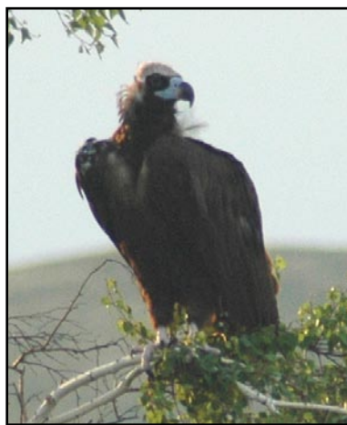
Гриф ( Aegypius monachus).