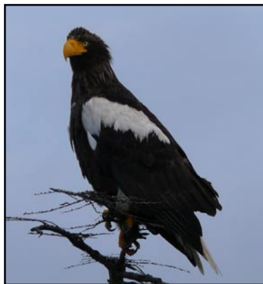
Белоплечий орлан ( Haliaeetus pelagicus ).

Eugene Osmelkin The Chuvashian Republican Environmental Society of Youth Afanasieva str., 13 Cheboksary 428018 Republic of Chuvashia Russia tel.: +7 (8352) 42 56 28 +7 (8352) 42 55 40 edemchr@mail.ru