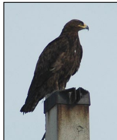
Степной орёл (Aquila nipalensis).  Steppe Eagle (Aquila nipalensis).

3. Realization of the program «Requirements on prevention of electrocutions of