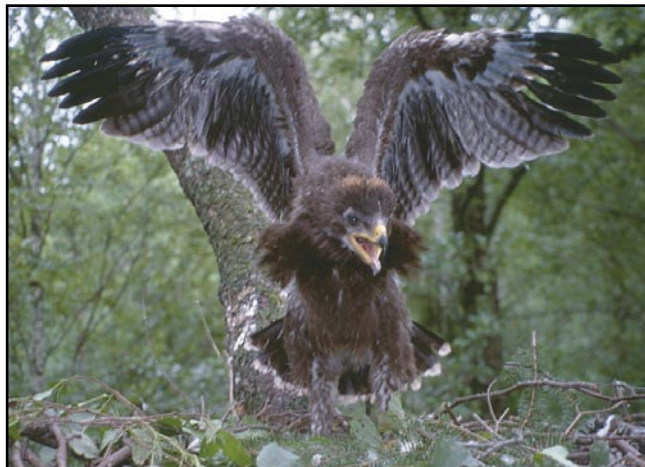
Птенец малого подорлика ( Aquila pomarina). Chick of the Lesser Spotted Eagle ( Aquila pomarina).