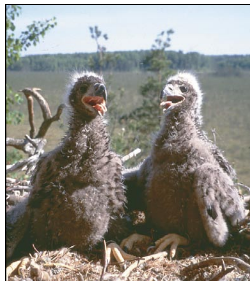
Chicks of the White-Tailed Eagle ( Haliaeetus albicilla ).