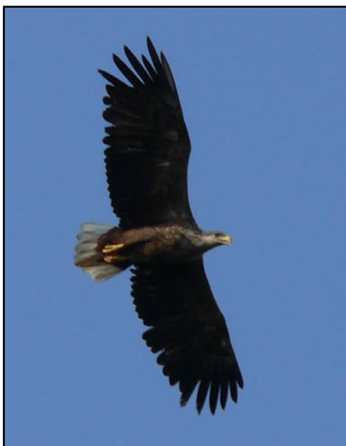
Орлан-белохвост ( Haliaeetus albicilla ). The White-Tailed Eagle ( Haliaeetus albicilla ).

Probably no less than 80–100 pair of White-tailed Eagles bred in the N. Novgorod district at the beginning of XX century, that estimations were some greater than modern number. Birds inhabited riparian forests in the Volga, Oka, Sura, Vetluga river valleys. The species number was not decreased up to 1940–50-s and regularly noted on all islands and shallows of the Oka and Volga rivers that time (Puzanov et al., 1955). According to E.M. Vorontsov (1967), White-tailed Eagles were noted more often, than Golden Eagles ( Aquila chrysaetos ). All in-