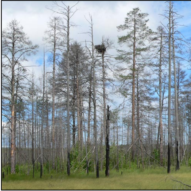
Гнездо орлана-белохвоста на усыхающей сосне.

The nest of the White-Tailed Eagle on a drying out pine.