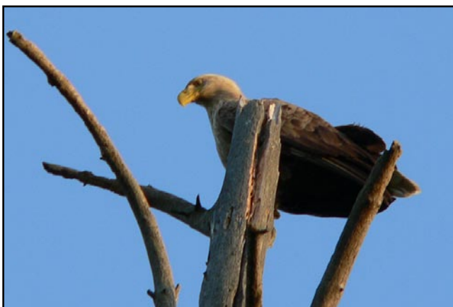
Орлан-белохвост на присаде. The White-Tailed Eagle on perch.

Серебровский П.В. Материалы к изучению орнитофауны Нижегородской губернии. – Матер. к познанию фауны и флоры России. Отд. зоол. М., 1918. Вып. 15. С. 23–134.