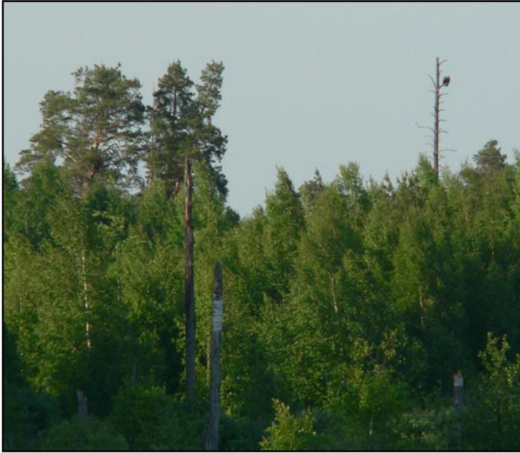
Орлан-белохвост на присаде близ гнезда.

The White-Tailed Eagle on perch near the nest.