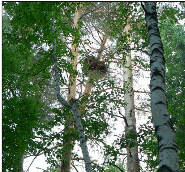
Гнездо орлана-белохвоста на сосне.

The nest of the White-Tailed Eagle on a pine.