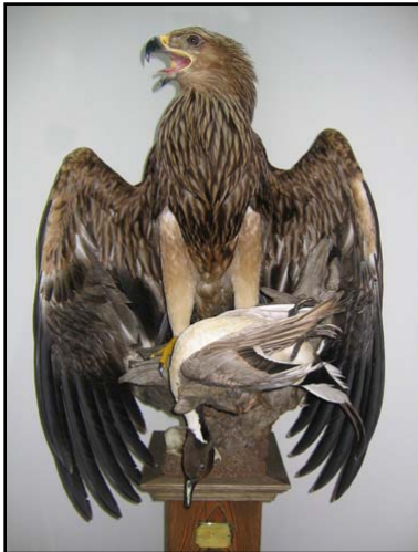
Чучело могильника ( Aquila heliaca ), продающееся в таксидермическом салоне под видом «коршуна».

Stuffed Imperial Eagle ( Aquila heliaca ) being sold as a "Kite" in a taxidermist's shop.