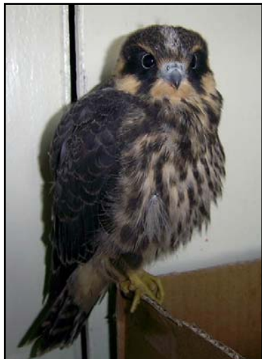
Челлок, продающийся как «дербник», в Интернет в частных объявлениях.

Hobby being sold as a "Merlin" in internet through private advertisements.