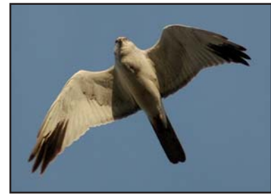
Самец степного луны ( Circus macrourus ).