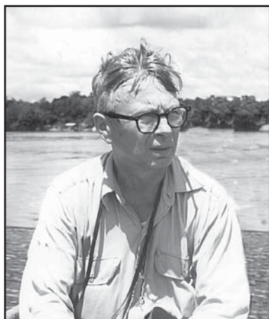
Дин Амадон.

Dean Amadon.