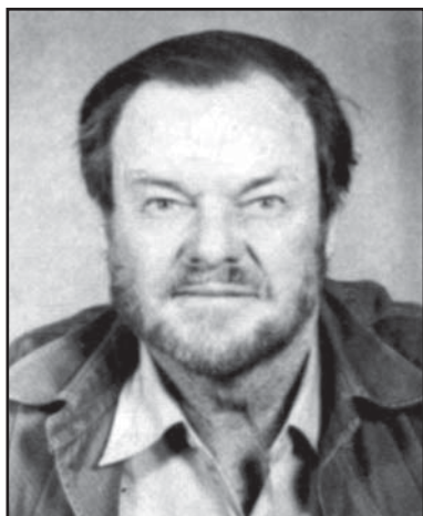
Лесли Браун.

Leslie Braun.