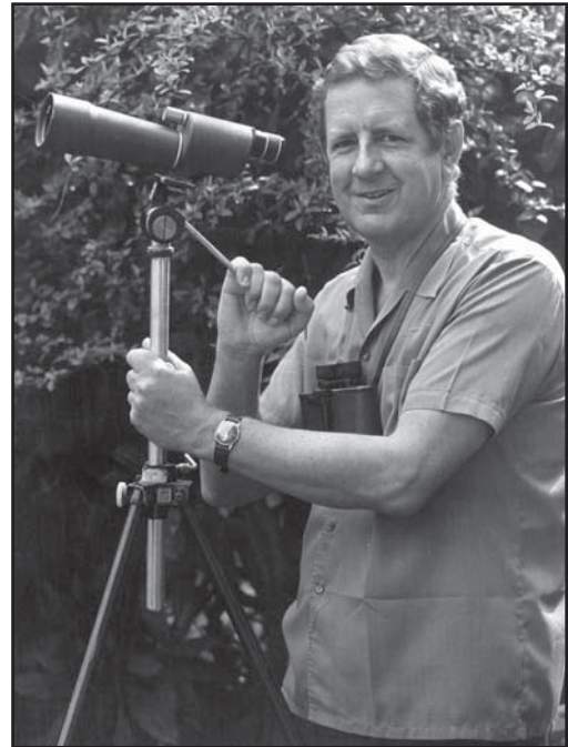
Джеймс Фергусон-Лийз. James Ferguson-Lees.

Джеймс широко путешествовал. Он участвовал почти во всех самых знаменитых экспедициях, которые дали значительный толчок природоохранному движению в Европе и мире. Так, например, он был в экспедиции от Эдинбургского университета на остров Святой Кильды (знаменитый ужасающей бедностью местного населения, всего век назад выживавшего за счёт сбора яиц морских птиц) в 1949 г., в англо-испанской экспедиции на Казорлу в 1959 г., вместе с Г. Маунфортом путешествовал в парк Кото Доньяна в 1956/57 гг., в Болгарию в 1960 г. и Иорданию в 1963–65 гг., был в международной поездке в Иорданию в 1966 г., в поездке, организованной Британским орнитологическим союзом, на озеро Чад в 1967–68 гг. Кроме того, он много путешествовал по Европе, Африке, Южной