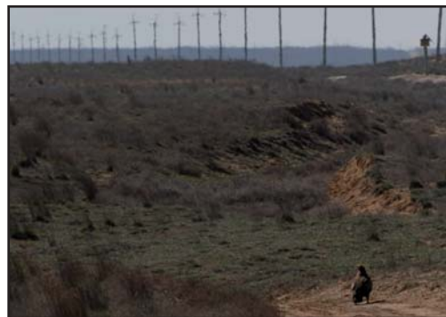
Степной орёл в зоне опасной ВЛ 6–10 кВ. Единственный способ остаться в живых – ходить по земле. Фото А. Машыны.

С учётом состояния обнаруженных костно-перьевых останков и тушек птиц определено примерное время их гибели: в 2010, в 2009, в 2008 году и ранее (табл. 2). Наибольшее количество обнаруженных птиц – 28 (48,3%) погибло в 2009 г. Средняя частота встреч птиц, погибших в этот период, составила 2,5 ос./км ВЛЭ. Присутствие останков мелких и средних