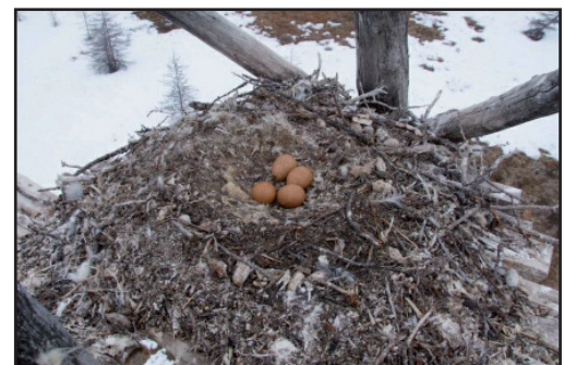
Кладка кречета. Clutch of the Gyrfalcon.

- there are no raptologists in the Anadyr department of Rosprirodnadzor, but prob-