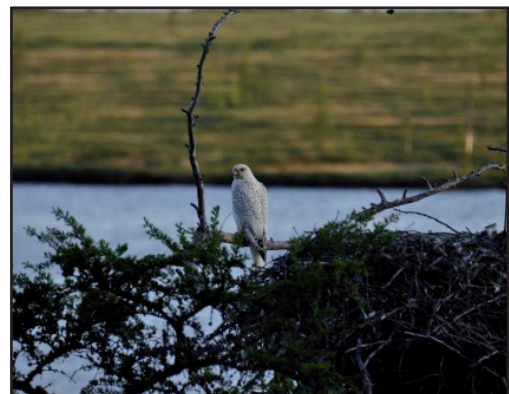
Кречет у гнезда.

You can ask: where is the answer to the main question: Gyrfalcon Project: is it profanation or corruption? Decide for yourself, the whole sequence of events has been presented above.