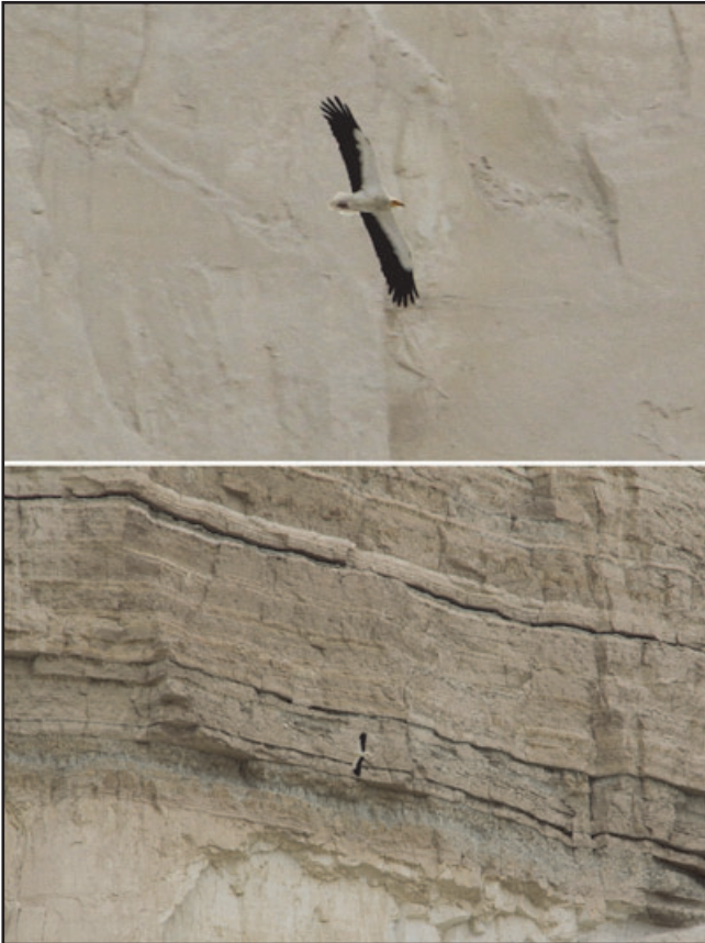
Стервятники ( Neophron percnopterus ) близ гнёзд (рис. 1–1,2). 25.04.2011.