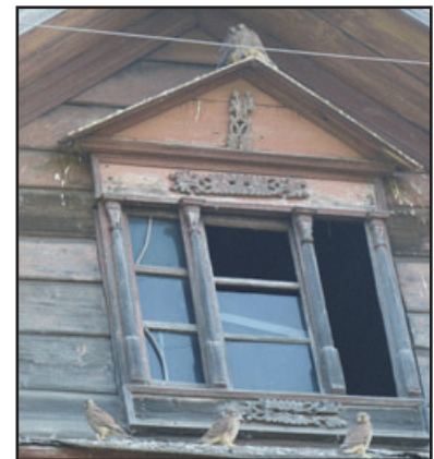
Выводок пустельги ( Falco tinnunculus ).

The Kestrel ( Falco tinnunculus ) nesting in a building was recorded in a settlement of the Kstovo region of the N. Novgorod district (fig. 1). Kestrels nested in the garret of a wooden two-story house, which was used as a summer cottage (it is inhabited almost since May to September) in 2009 and 2011. Kestrels were successful in both years; they produced 5 young per year.