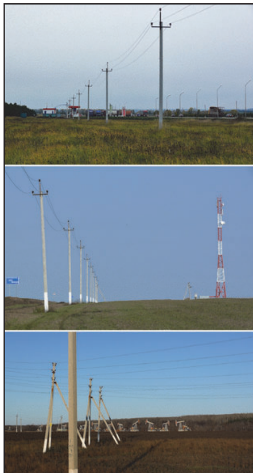
Птицепоопасные ЛЭП, подающие электроэнергию на автозаправочные станции (вверху), вышки сотовой связи (в центре), объекты нефтелобьичи (внизу).

In spite of the fact that during autumn it is possible to trace the most part of birds killed by electrocution, this season does not give a complete picture of bird mortality caused by electrocution. We examined PL going across fields, where after harvesting the land was not ploughed, and PL along the road. Choosing the areas for surveys we took PL located far from the forests. In this case there is no choice for birds for nesting. The great number