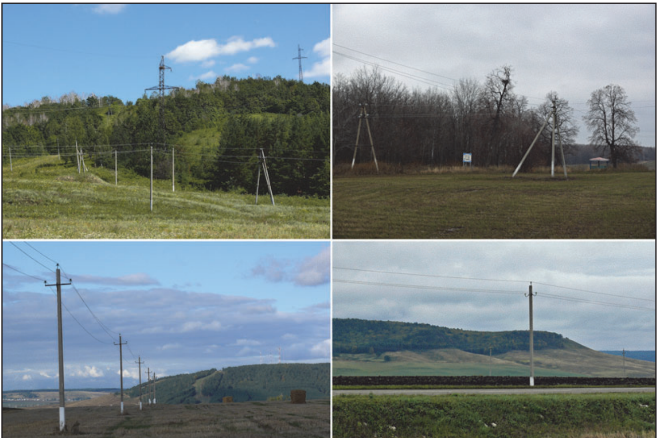
Птицепоопасные ЛЭП на гнездовых участках орла-могильника ( Aquila heliaca ), в том числе непосредственно под гнёздами орлов (внизу).

Всего за период с 3 сентября по 18 октября 2011 г. обследована 101 птицепоопасная ЛЭП (часть из них – линии, идущие по 2 и 3 параллельно, в нескольких метрах друг от друга) в 14 районах республики: Елабужском, Тукаевском, Нижнекамском,