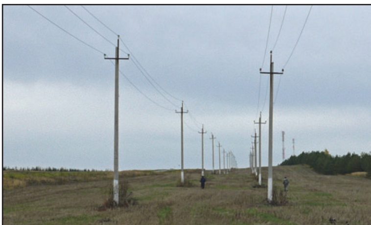
Птицепопасные ЛЭП, идущие в нескольких метрах параллельно друг другу.

Сравнивая биотопическое расположение ЛЭП в Алтае-Саянском регионе (Карякин и др., 2009) и Республике Татарстан, наблюдаем определённую разницу. Например, в Республике Алтай обследовались ЛЭП, расположенные в пастбишных степях с низкой травой, с богатым кормовым ресурсом в виде грызунов. Там опоры ЛЭП – единственно возможные присады для хищных птиц. Всё это привлекает их сюда. В условиях Татарстана низкая растительность в полях бывает ограниченное время. Изучив останки птиц и сроки давности их гибели, мы предположили, что, вероятно, основное количество пернатых в полях гибнет, когда культуры набирают рост, а также во время уборочных работ и после их проведения, когда низкое жнивье или всходы озимых снова привлекают к себе птиц. Это, главным образом, врановые и птицы-миофаги: обыкновенный канюк ( Buteo buteo ) и обыкновенная пустельга ( Falco tinnunculus ). Под опорами ЛЭП в полях, под которыми росла либо высокая трава, либо неубранные сельскохозяйственные культуры, погибших птиц в осеннее время