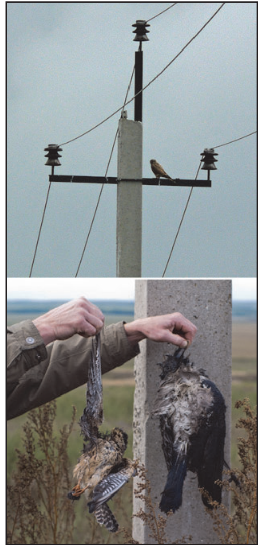
Пустельга, сидящая на птицепасной опоре ЛЭП (вверху) и кобчик ( Falco vespertinus ) и серая ворона ( Corvus cornix ), погибшие на опоре аналогичной конструкции (внизу).

За этот короткий период исследования нами не обнаружены факты гибели крупных хищных птиц, таких как орлан-белохвост, орёл-могильник, большой подорлик. Мы упустили сроки пролёта крупных хищных птиц, а также не отследили участки возможных миграционных путей. Хотя в ранее проведённых исследованиях (Салтыков, 1999) подчёркнуто, что в условиях Татарстана гибель птиц во время их