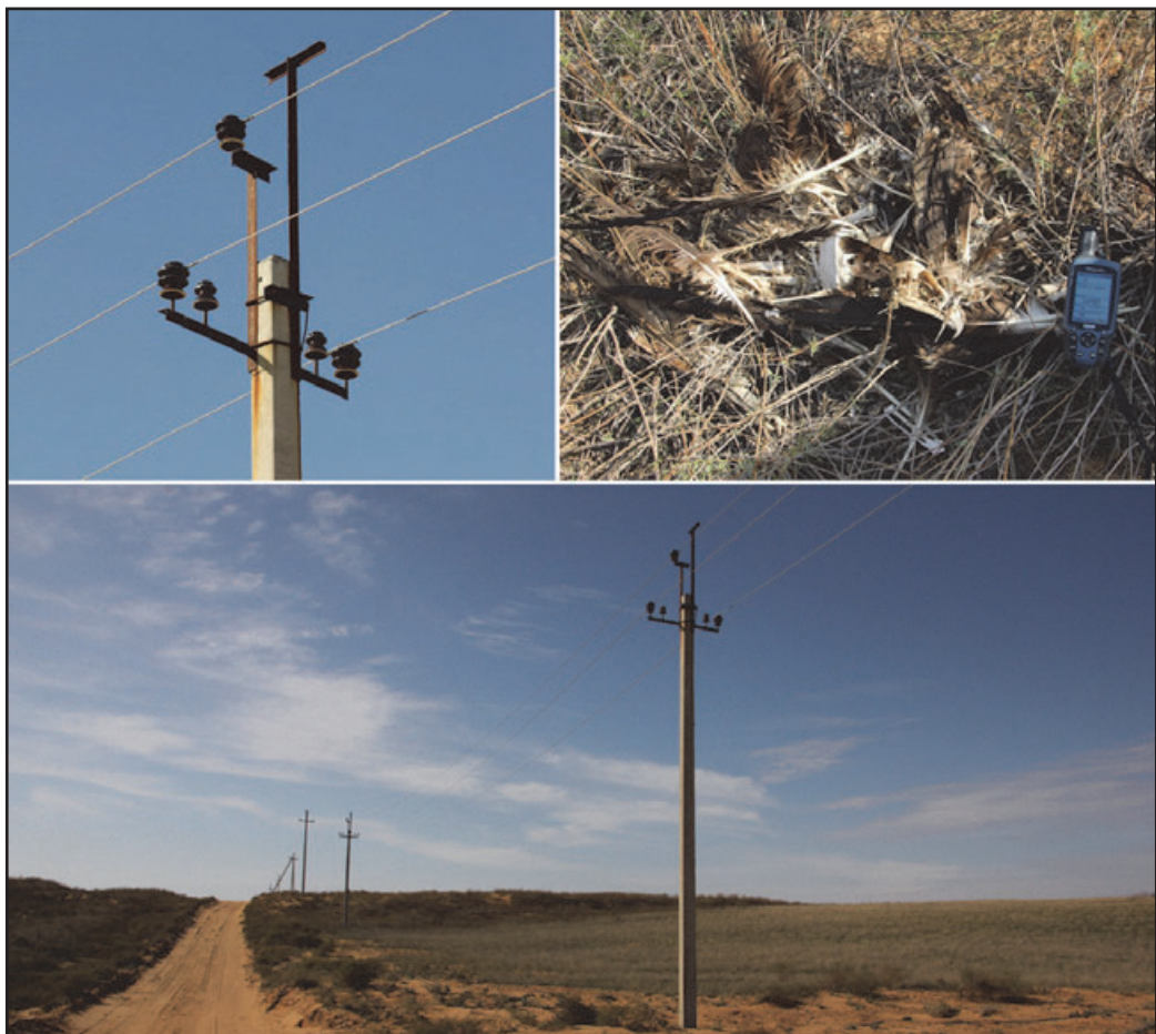
Power line of the cathodic protection of CPC's pipeline (upper at the left) and remains of a Steppe Eagle, died on the PL (upper at the right). Astrakhan district, Russia, 11/10/2011.