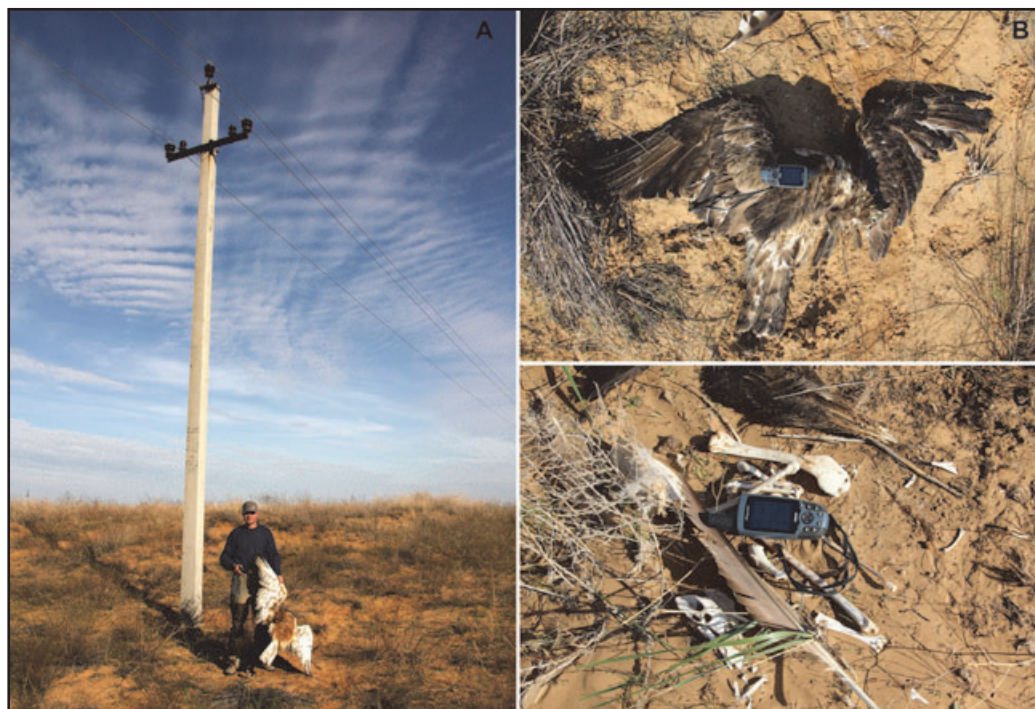
Fig. 4. А, В – Short-Toed Eagle ( Cicaetus gallicus ) died on the PL of 'Gazprom Transgas Stavropol' (line Makat-North Caucasus), 11/10/2011, С – bone and feather remains of a Steppe Eagle, died on the PL of 'Gazprom Transgas Stavropol' (line Makat-North Caucasus), 11/10/2011. Astrakhan district, Russia.

в данном случае может быть на порядки больше того, что был установлен нами.