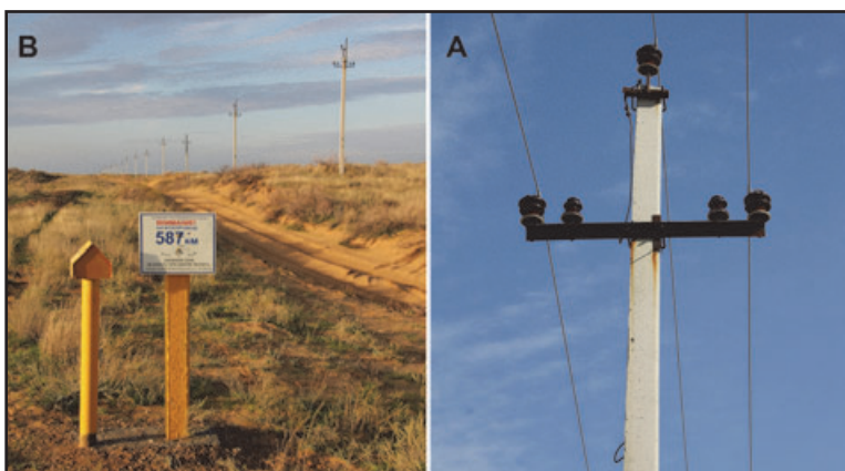
Рис. 3. А – оголовок опоры ВЛ «Газпром трансгаз Ставрополь» (трубопровод Мака́т-Северный Кавказ), В – ВЛ катодной защиты трубопровода АО КТК. Астраханская область, РФ, 11.10.2011.

Once again, it was confirmed that false insulators are not effective as bird protection devices and must be replaced with effective caps made of plastic, or the lines should be retrofitted by using LV aerial bundled cable or suspended insulators. At the same time the T-shaped perches, designed to distract birds, can be a positive addition to any of these variants.