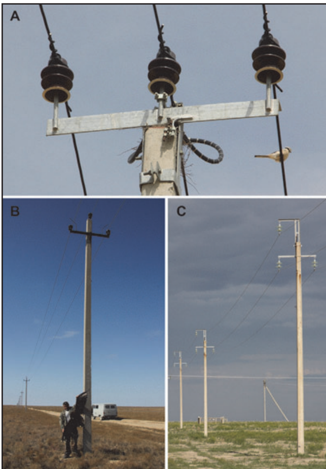
Рис. 1. А – гнездо серого сорокопута ( Lanius excubitor) на оголовке опоры ВЛ КТК-К, оборудованной изолированным самонесущим проводом СИП-3, 05.05.2011, В – степной орёл ( Aquila nipalensis), погибший на ВЛ «Интергаз Центральная Азия» (трубопровод Мака́т-Северный Кавказ), 28.09.2011, С – опоры ВЛ КТК-К, оборудованные подвесными изоляторами, 04.05.2011. Атырауская область, РК.

In this section, bone and feather remains of three Steppe Eagles ( Aquila nipalensis ) (fig. 4–C) and a Long-Legged Buzzard ( Buteo rufinus ) were found, as well as a dead Short-Toed Eagle ( Cicetus gallicus ), which probably died in September 2011 (fig. 4–A, B). It is worth noting that this is only the second registration of the Short-Toed Eagle