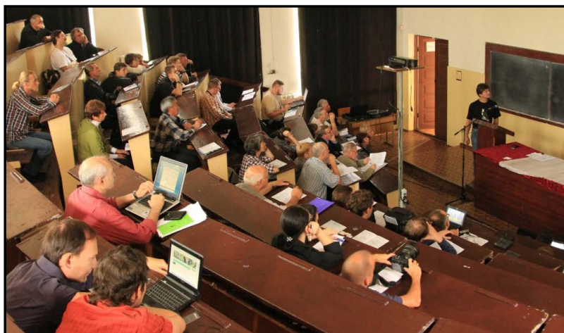
Рабочий момент VI Международной конференции по соколообразным и совам Северной Евразии «Хищные птицы в динамической среде третьего тысячелетия: состояние и перспективы». 27–30 сентября 2012 года, Кривой Рог, Украина.

A working time of the VI International Conference on the Birds of Prey and Owls of Northern Eurasia "Birds of Prey in a Dynamic Environment of the III Millennium: Status and Prospects". 27–30 September 2012, Krivoy Rog, Ukraine.