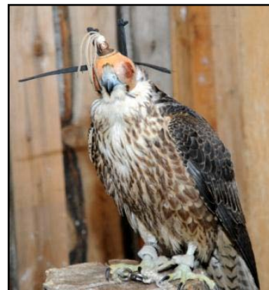
Сокол, ввезённый в Хакасию.

В районе мыса Африка, ПСКР «Камчатка» задержал судно ПТР-5031 (ООО «Транс-Марин»). Высадившиеся на его борт оперативники обнаружили 58 кре-