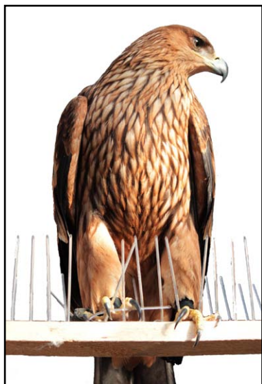
Орёл-могильник ( Aquila heliaca ), спокойно восседающий на присаде, оснащённой устройствами Ёж-стандарт производства ООО НПИЦ «Агрокон».

Besides real bird protective devices (BPD) violating the determination of such devices established in the Requirement on Prevention of Death of Animals in the Implementation of Production Processes, as well as Operation of Ways, Pipelines, Communication and Power Lines, the Grid company has recognized plastic bird spikes (Ezh-standard devices) manufactured by the "Agrokon" company and intended to prevent roosting of pigeon-sized birds or smaller as BPD. Thus the "Elabuzhskie electricity networks" has installed 1400 such spikes, including on the territory of the National Park "Nizhnyaya Kama". This decision caused a protest of the Russian