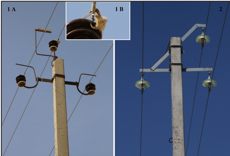
Рис. 2. Траверса ВЛЭ АО «КазТрансГаз» со штыревыми изоляторами – наиболее распространённый и опасный для птиц вариант конструкции – 1А. На верхнем проводе видна лапа филина ( Bubo bubo ), погибшего от поражения электрическим током – 1В. Опоры ВЛЭ АО «КазТрансОйл», оборудованные траверсами «ласточкин хвост» с подвесными тарельчатыми изоляторами, также опасны для крупных хищных птиц и нуждаются в дооборудовании ПЗУ – 2.

Fig. 2. 1A: The cross-arm of the middle-voltage power line with pin-type insulators owned by “KazTransGas” corporation. The power line with pin-type insulators is the most common, but the most bird-hazardous type of power line construction. 1B: A foot of an Eagle Owl ( Bubo bubo ) died from electrocution hanging from the upper wire is visible on the photo. 2: Pylons of a middle-voltage power line equipped with “swallow-tail”-type cross-arms with suspended cap-and-pin insulators owned by “KazTransOil”. Power lines of this construction are also dangerous for a large Birds of Prey and must be modified with a bird protective devices.