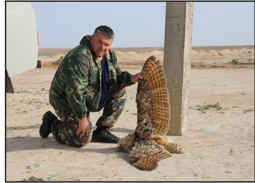
Филин ( Bubo bubo ), погибший на опоре ВЛЭ катодной защиты трубопровода АО «КазТрансГаз». Весна 2015 г.

В ходе реализации проекта мы дважды (в октябре 2014 г. и в апреле 2015 г.) провели учет погибших птиц на ВЛЭ средней мощности на территории Мангистауской области. Всего было обследовано 440 км ВЛЭ катодной защиты, принадлежащих государственным компаниям АО «КазТрансГаз» (250 км) и АО