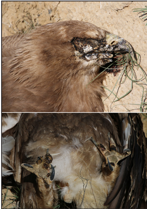
Fig. 3. Charred feet and head of a Steppe Eagle ( Aquila nipalensis ) killed at a power pole owned by JSC KazTransOil: these burn marks are typical for large birds electrocuted at structures with metal dovetailed crossbars.

ными лапами и головой (рис. 3). Данные повреждения были получены в результате короткого замыкания птицами, севшими на нижнюю горизонтальную составляющую траверсы и коснувшись верхнего токонесущего провода головой. Очевидно, что и траверсы «ласточкин хвост» в сочетании с оголенным токонесущим проводом должны быть оборудованы современными эффективными ПЗУ.