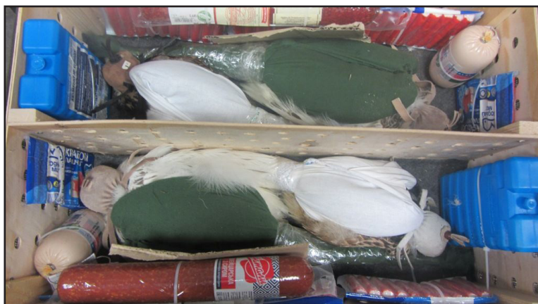
Соколы, задержанные на Украине в ноябре 2016 г. Оперативная съёмка.

Задержанный объяснил, что перевезти птиц в Бейрут его попросило неизвестное лицо за вознаграждение в размере 100 долларов США. Также мужчина рассказал, что получил посылку на территории аэропорта, а о её содержимом якобы ничего не знал.