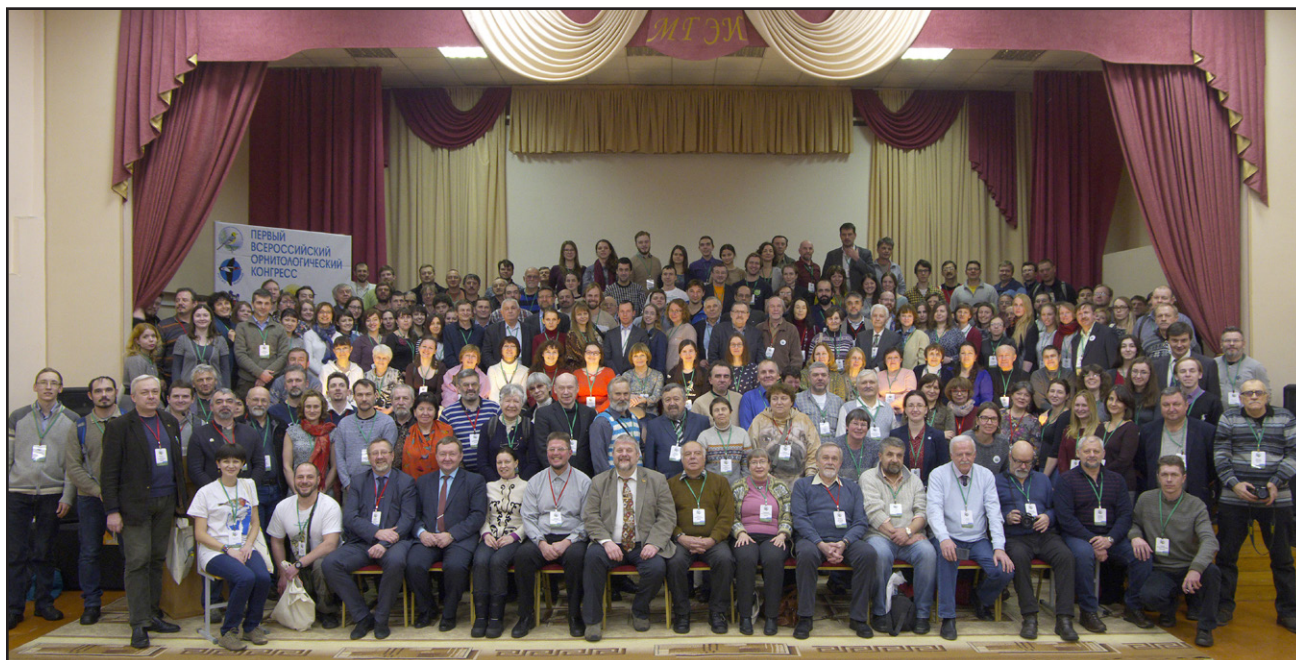
Участники конгресса.

Participants of the Congress.