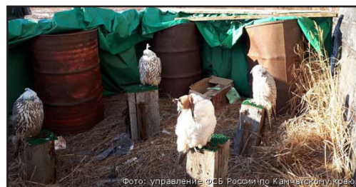
Кречеты, изъятые в октябре 2017 г. на Камчатке.

The investigating committee informed that one of the members of the criminal group was a person involved in the same criminal case in 2016, when the capture took place in the Olyutorsky district. He was detained only in June 2017 in the territory of the Crimea and is held in custody now 62 .