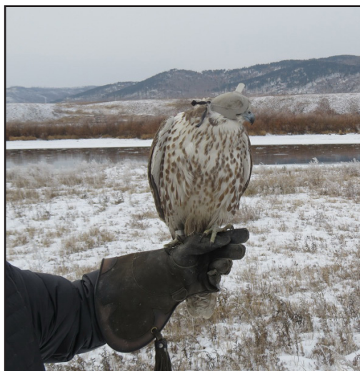
Выпуск балобана, изъятых в Забайкальском крае.

Releasing of a Saker Falcon arrested in Zabaikalye Region.