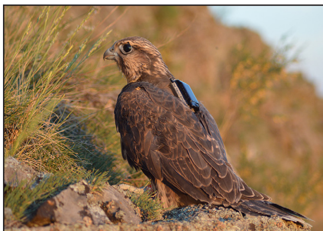
Хакасский балобан ( Falco cherrug ), помеченный GPS/GSM-трекером в июне 2016 г.

Just before, a Syrian citizen and a native of Kazakhstan made an assault upon a state inspector, who tried to detain them in the same reserve cluster for poaching capture of falcons. Violators attacked with a knife a member of the reserve, but he made resistance and they fled. Based on the report