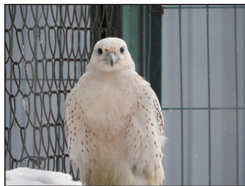
Белый кречет, изъятый в Омской области.

Курьер рассказал, что получил птицу в одной из квартир в г. Петропавловске-Камчатском, где позже оперативники задержали троих россиян. В помещении были найдены следы содержания птицы, а также шприцы с транквилизаторами, которыми её, видимо, кололи.