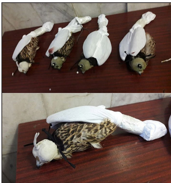
Балобаны, задержанные в Бишкеке.

The relevant administrative documents were drawn up. The detected birds were