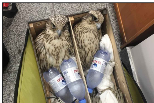
Кречеты ( Falco rusticolus ), которых контрабандисты пытались вывезти в ОАЭ.

Gyr Falcons ( Falco rusticolus ) subjected for smuggling to the United Arab Emirates by poachers.